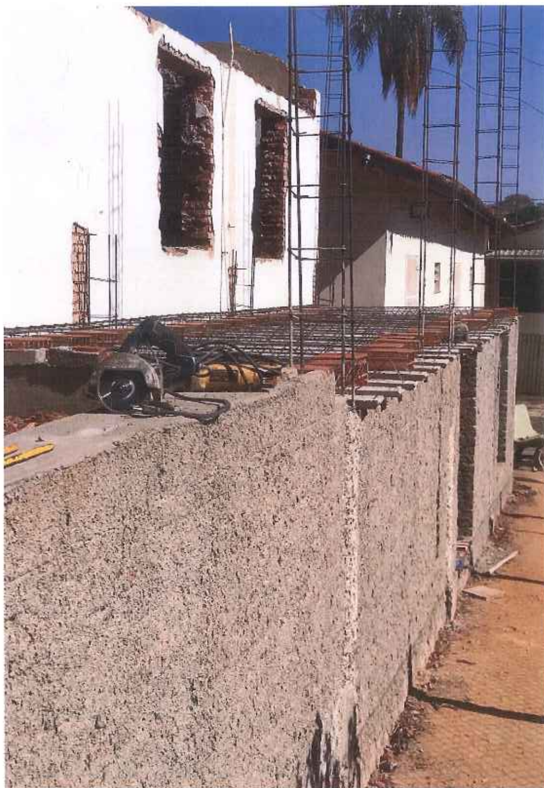
Foto 13 – Montagem dos trilhos e lajostas do piso da área de expansão – data: 16/09/2021