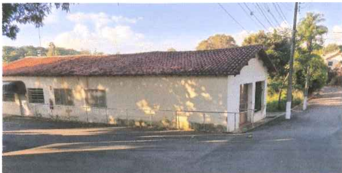
Foto 1 – Visão geral do antigo prédio para Reforma e Ampliação – data: 15/06/2021