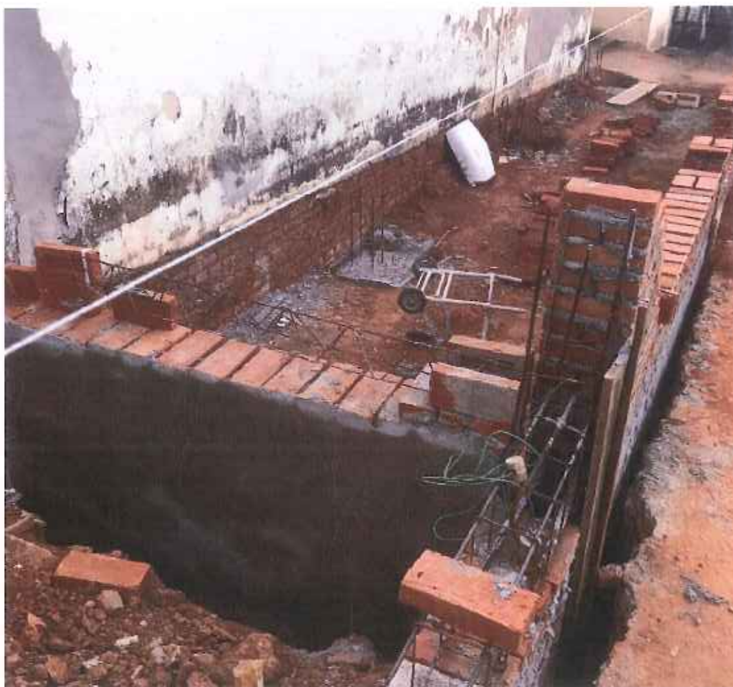
Foto 02 – Impermeabilizando as paredes do baldrame – data: 02/09/2021