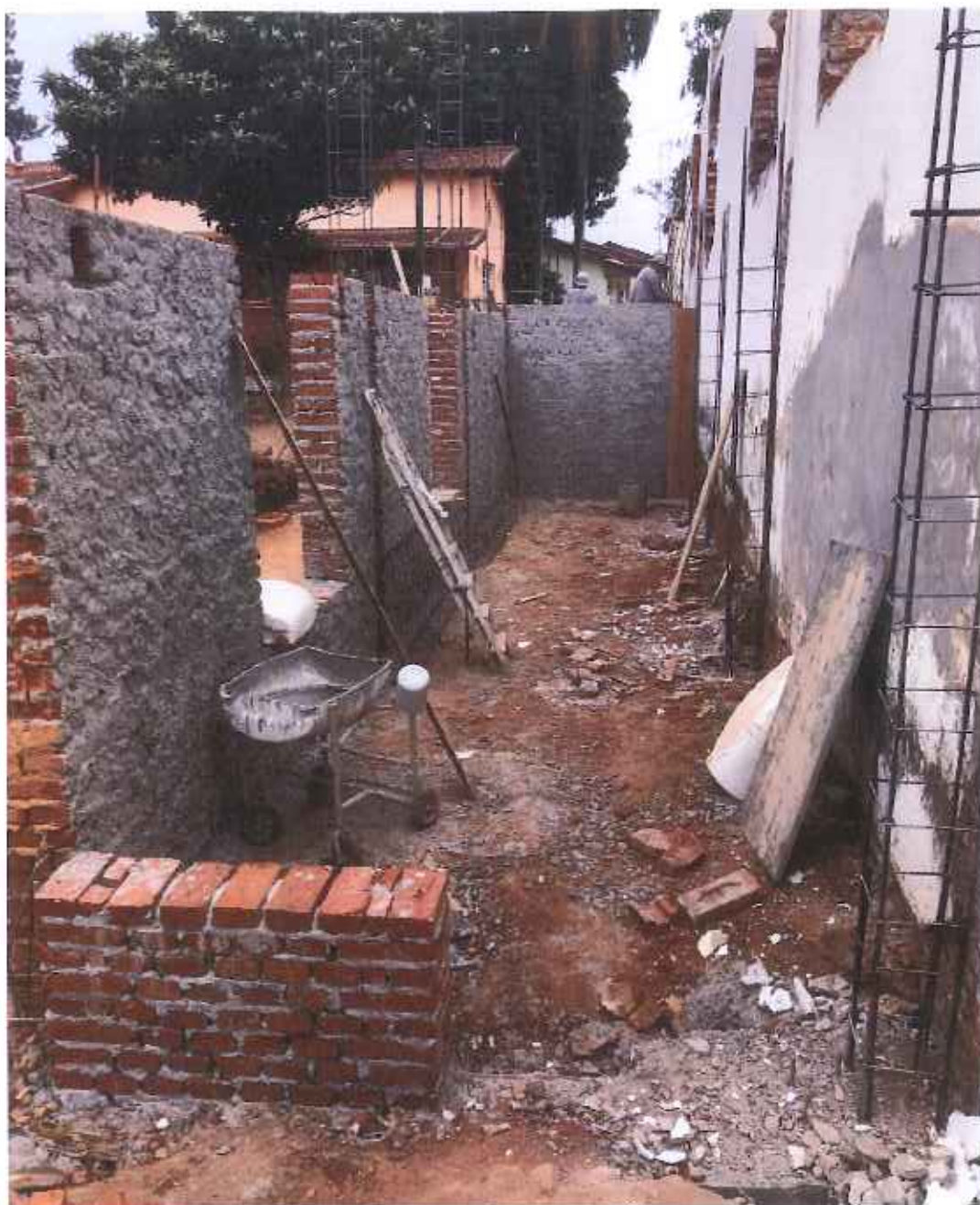
Foto 06 – Chapisco interno e externo da parede externa – data: 06/09/2021