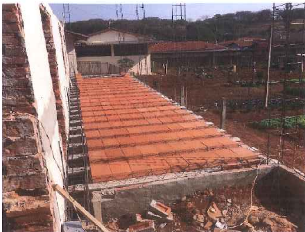
Foto 14 – colocação lajotas no piso da área expansão – data: 16/09/2021