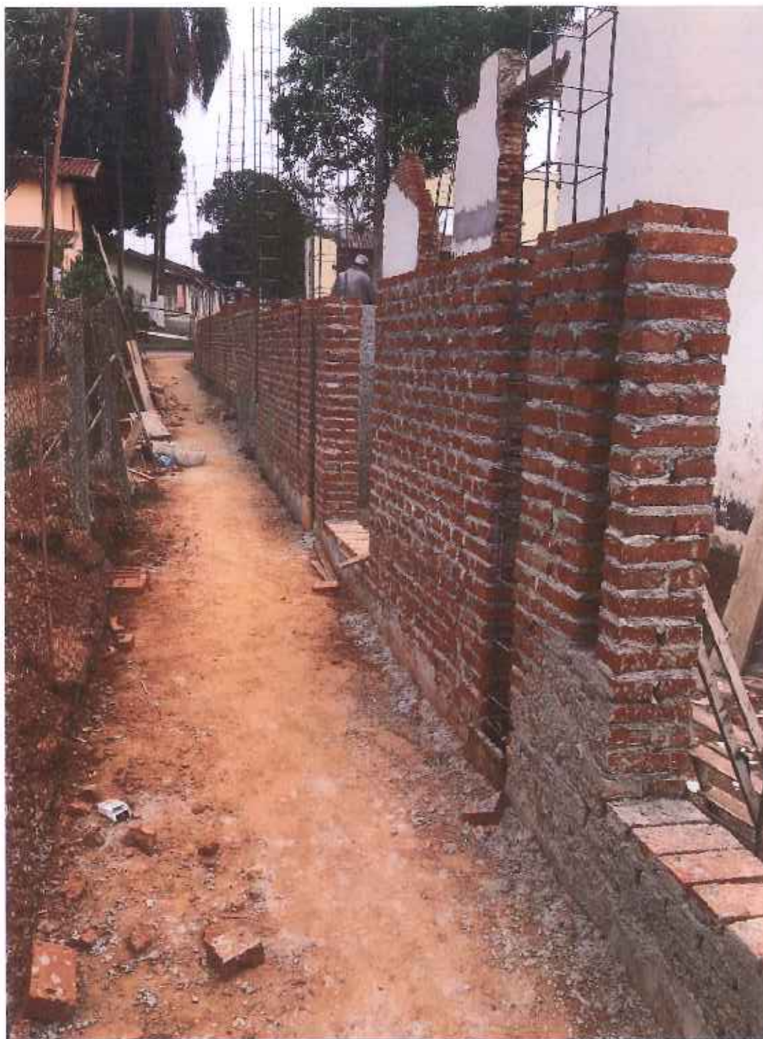
Foto 04 – Levantamento da parede externa de nivelamento – data: 03/09/2021