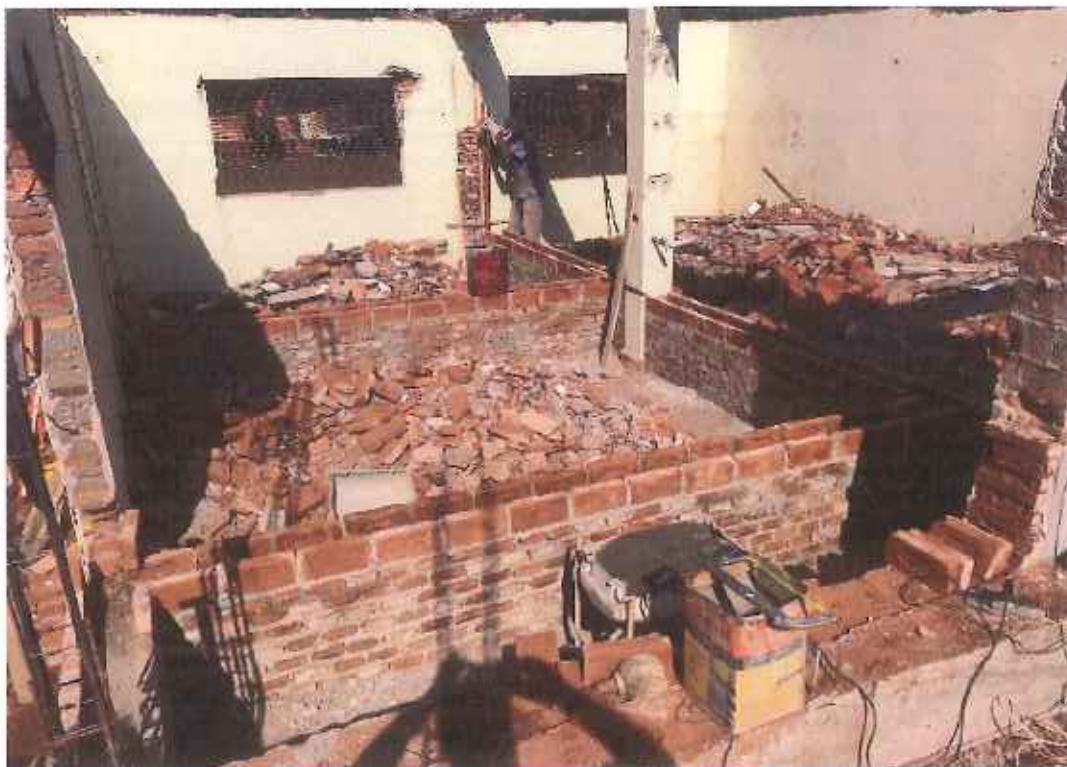
Foto 16 – construção do baldrame e canaletas de salas internas – data: 20/09/2021