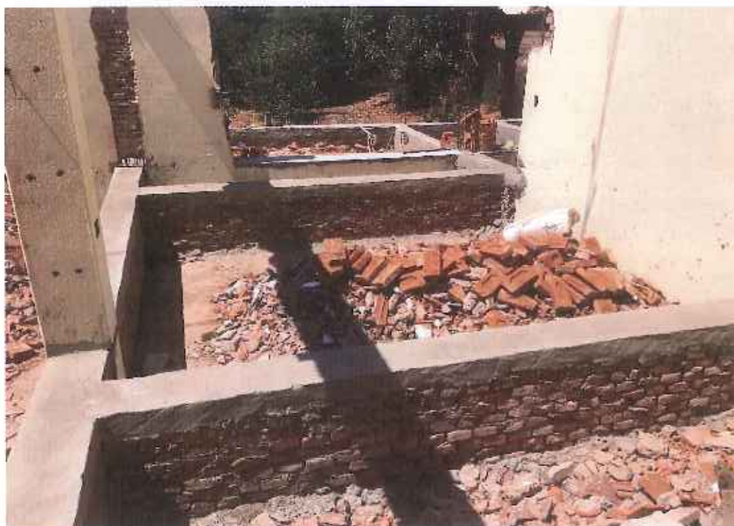
Foto 17 – enchimento e impermeabilização baldrame – data: 22/09/2021