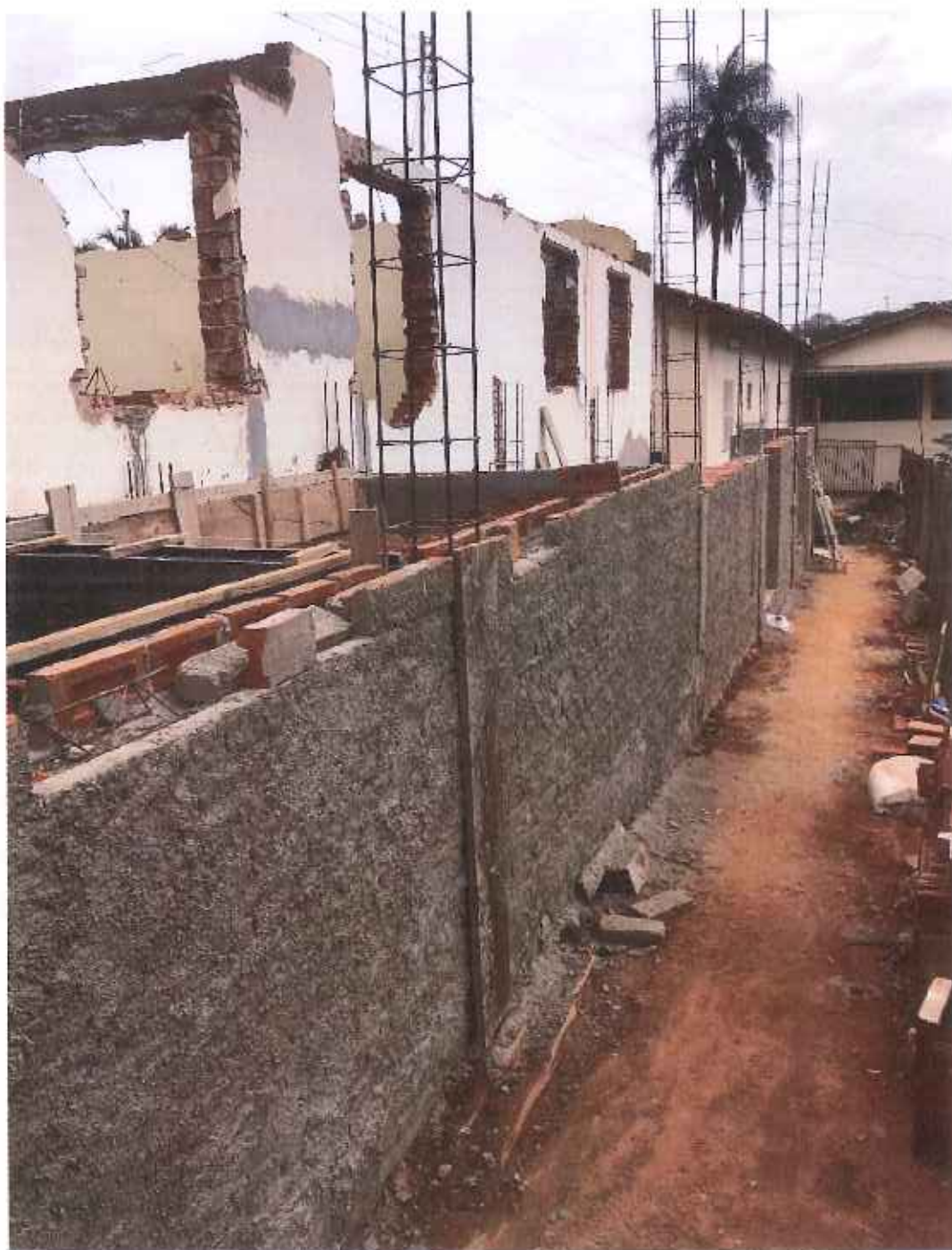
Foto 07 – Chapisco externo da parede externa lateral – data: 10/09/2021