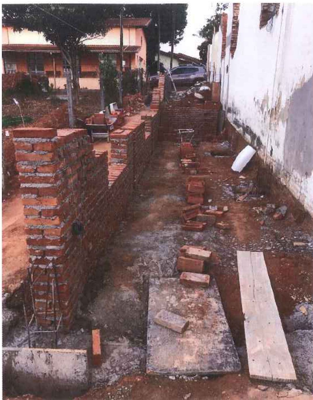
Foto 03 – Levantamento da parede externa de nivelamento – data: 02/09/2021