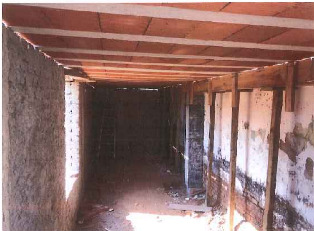
Foto 15 – parte inferior piso da área de expansão – data: 16/09/2021