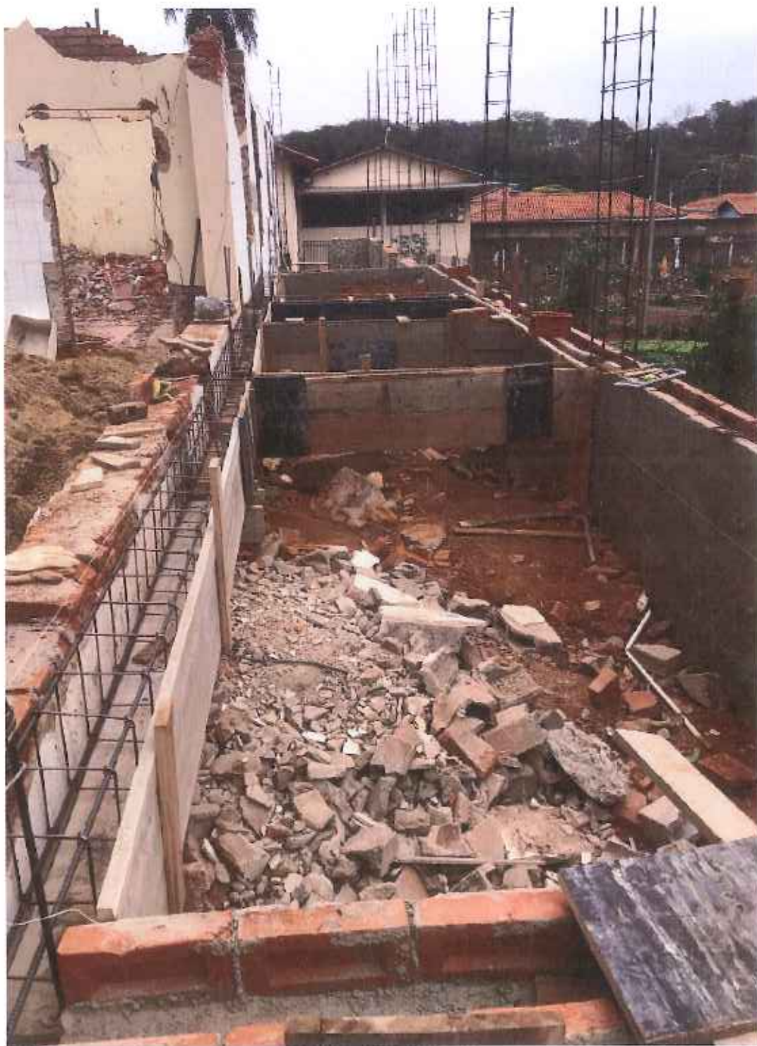
Foto 05 – Montagem e concretagem de vigas e pilares – data: 06/09/2021