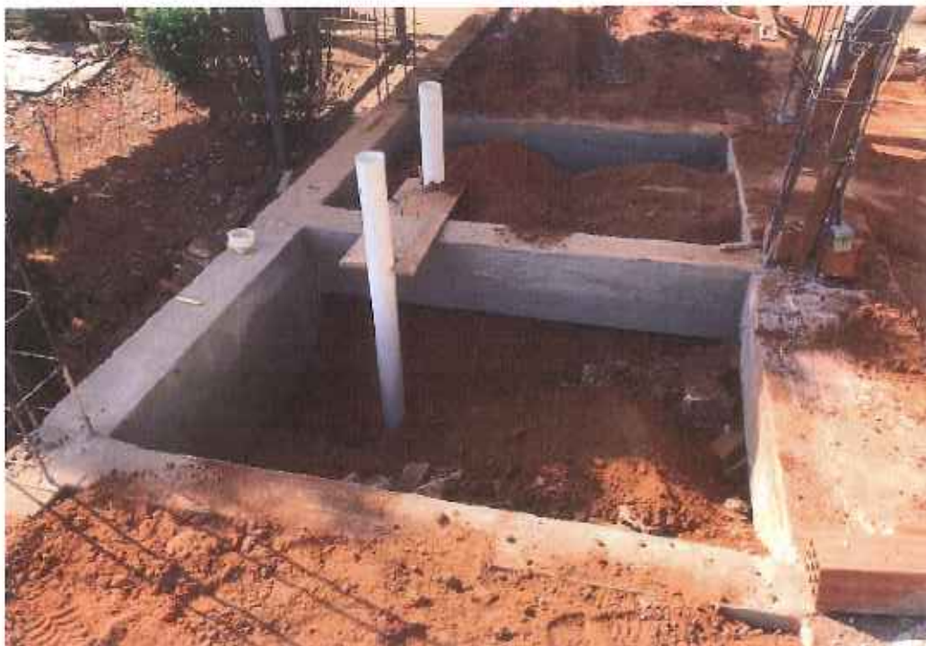
Foto 11 – impermeabilização de baldrame e vigas – data: 15/09/2021