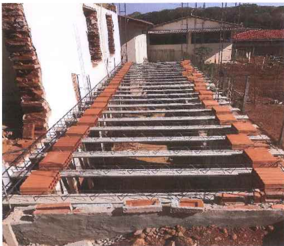
Foto 12 – montagem laje de piso da área de expansão – data: 16/09/2021