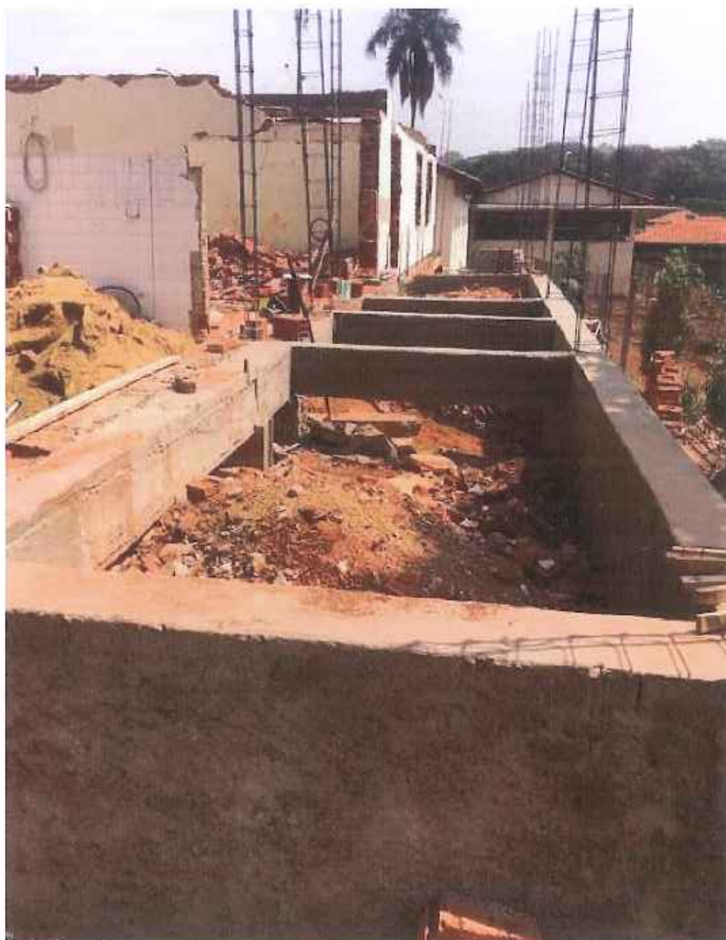
Foto 10 – desmontagem de formas de vigas e pilares – data: 14/09/2021