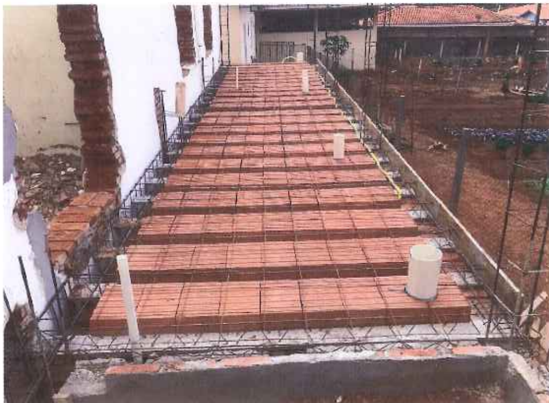
Foto 19 – preparação final tubulação esgoto e concretagem – data: 27/09/2021