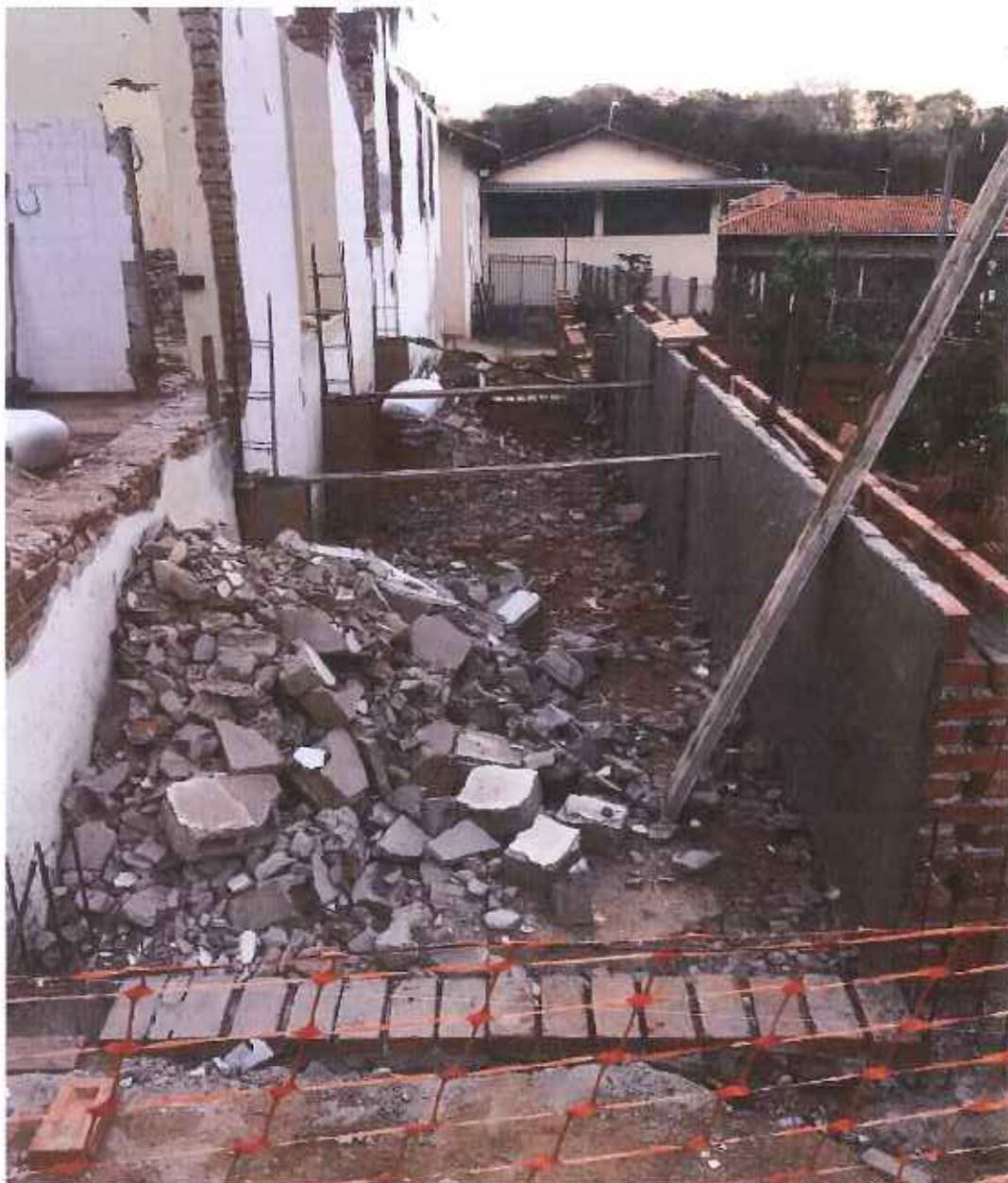
Foto 01 – Impermeabilizando as paredes do baldrame – data: 01/09/2021