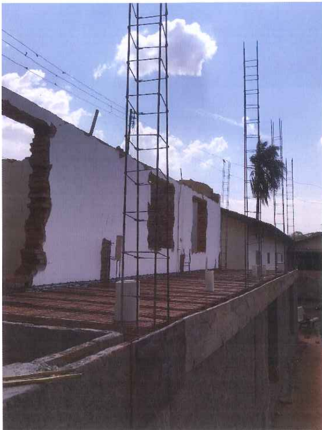
Foto 18 – preparação final tubulação esgoto e concretagem – data: 27/09/2021